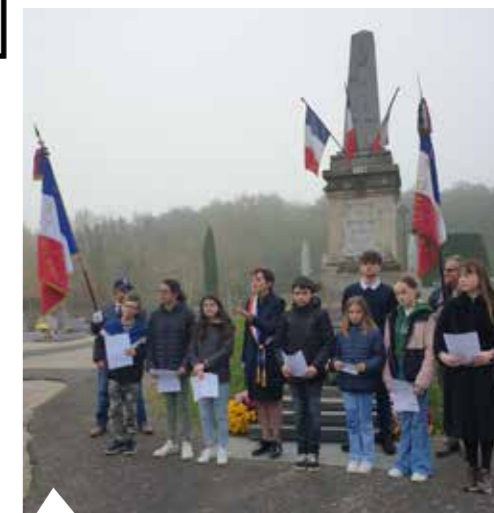
11 novembre : Commémoration de l'armistice de 1918 en présence de l'UNC du Pays de Nozay – mémoire et du Conseil Municipal des Jeunes (CMJ).

26 novembre : Sainte-Barbe avec les pompiers du CIS de Saffré.