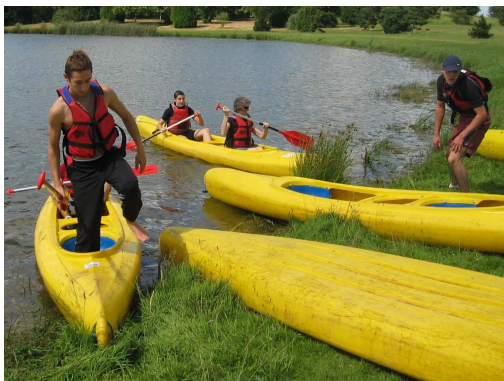
Loisirs à l'Air Libre