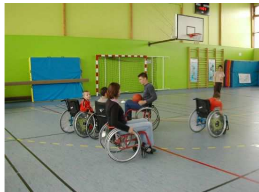
Sensibilisation au handisport