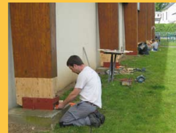
Reprise des piliers du Gymnase du Pré Saint-Pierre.