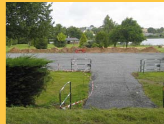
Aménagement d'une plate-forme pour l'implantation du skate-park aux étangs de Nozay.